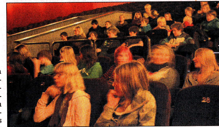
Schulkinowoche: Nach dem Film „Friendship!“ wurde im Kino 4 des Cineplex über den Film diskutiert.

Bis zu zwei Jahre können von der ersten Idee bis zum fertigen Film vergehen. „Friendship!“ basiert auf ei- genen Erlebnissen, so Som- mer. Nur der dramatische Schluss sei ausgedacht: „Das merkt man.“ Sowohl die erste Idee, das Exposé als auch das „Treatment“, und schließlich